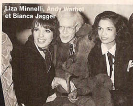
Liza Minnelli, Andy Warhol et Bianca Jagger

INFOS SPY BAR : 101 Greene Street. NV : 289 Spring Street. JET LOUNGE : 286 Spring Street. LIQUID : 21 st Street & 11th Avenue. CHEETAH : 12 W. 21st Street. SOROKKO GALLERY : 430 West Broadway. Tél. 00.1.212.941.8888.