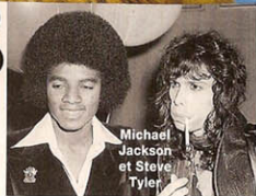
Michael Jackson et Steve Tyler