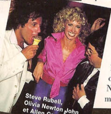
Steve Rubell, Olivia Newton John et Allen Carr.